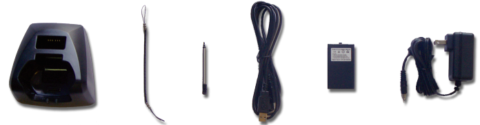
Base de Carga y Comunicaciones